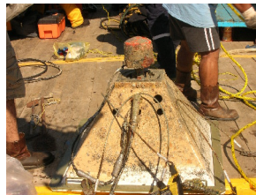
Fig. 2.4.7.1. Condiciones antes del mantenimiento RDCP-600. (N.S.60).

Falto de aceite en el buje de entrada del sensor de presión, con presencia de sedimento. La figura 2.4.7.1 se muestra el equipo RDCP-600 (N.S.60) en su totalidad tal y como fue extraído.