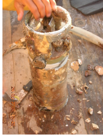
Fig. 2.3.2.1 Condiciones antes del mantenimiento WTR-9. (N.S.33).

La figura 2.3.2.1. Muestra el equipo en su estado inicial.