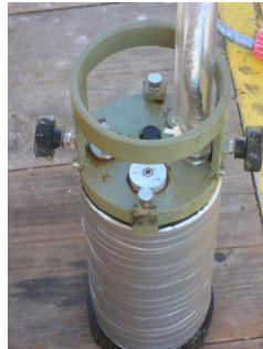
Fig. 2.1.3.1. WTR-9. (N.S.122) En condiciones después del mantenimiento.

El equipo después de su mantenimiento y tal como fue instalado se muestra en la siguiente figura 2.1.3.1.