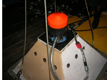
Fig. 2.4.8.2. Condiciones después del mantenimiento RDCP-600. (N.S.60).

En la figura 2.4.8.2 se presenta el equipo oceanográfico RDCP-600 (N.S.60) tal y como fue depositado en lecho marino.