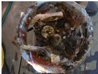
Fig.2.1.2.1. WTR-9 (N.S.122). En condiciones antes del mantenimiento.

El equipo se muestra tal y como fue extraído en la siguiente figura 2.1.2.1, en condiciones iniciales.