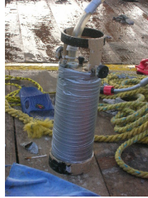
Fig. 2.2.3.1. Condiciones después del mantenimiento del WTR-9. (N.S.125)

Después de su mantenimiento el equipo fue instalado tal y como se muestra en la figura 2.2.3.1.