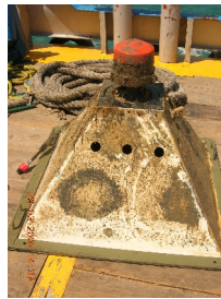
Fig. 2.3.7.1. Condiciones antes del mantenimiento RDCP-600. (N.S.62).

La figura 2.3.7.1 muestra el equipo en su estado inicial, después de ser extraído del lecho marino.