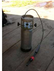
Fig. 2.4.3.1. WTR-9. (N.S.124). En condiciones después del mantenimiento

En la figura 2.4.3.1 se presenta el equipo oceanográfico tal y como fue instalado después del mantenimiento.