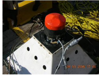
Fig. 2.3.8.1 Condiciones después del mantenimiento RDCP-600. (N.S.62).

Se muestra al equipo después del mantenimiento, en la figura. 2.3.8.1.