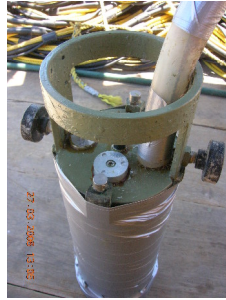
Fig. 2.3.3.1 Condiciones después del mantenimiento WTR-9. (N.S.34).

Se muestra al equipo después del mantenimiento, en la siguiente figura 2.3.3.1