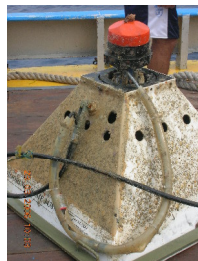
Fig. 2.2.7.1. Condiciones antes del mantenimiento del RDCP-600 (N.S.63).

El equipo oceanográfico RDCP-600 (N.S.63) fue extraído en condiciones presentadas en la figura 2.2.7.1.