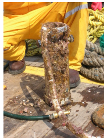
Fig. 2.2.2.1 condiciones antes del mantenimiento Del WTR-9. (N.S.125)

El equipo es mostrado tal y como fue extraído, en sus condiciones iniciales en la figura 2.2.2.1.