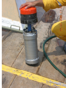
Fig. 2.2.8.1. Condiciones después del mantenimiento del RDCP-600. (N.S.63).

La instalación del equipo se llevo a cabo cuando el equipo estaba en condiciones presentadas en la figura 2.2.8.1.