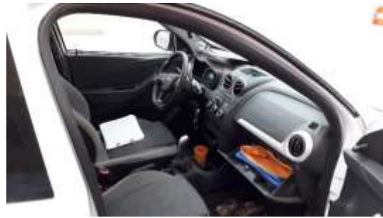
Ilustración 9. Vista de interior del vehículo adquirido por el área comercial