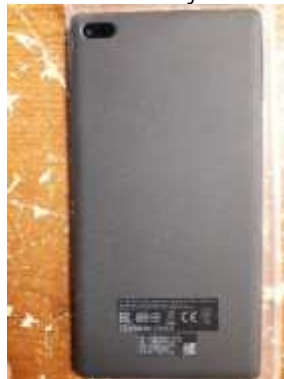
Ilustración 4. Evidencia de tabletas adquiridas para la captura y transmisión inalámbrica de datos