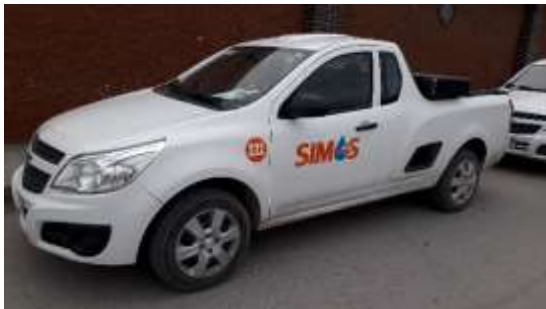
Ilustración 8. Vehículo adquirido para el área comercial