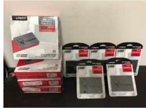
Ilustración 7. Evidencia de discos duros adquiridos conforme a especificaciones del Proyecto ejecutivo.