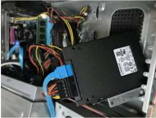
Ilustración 6. Disco duro instalado en equipo de la subgerencia de área comercial y cortes.