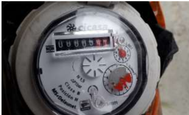
Ilustración 1. Evidencia fotográfica de medidor adquirido por el SIMAS, la evidencia es parte del informe de campo de supervisión de medidores