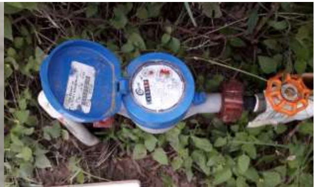
Ilustración 2. Evidencia fotográfica de medidor adquirido por el SIMAS, la evidencia es parte del informe de campo de supervisión de medidores