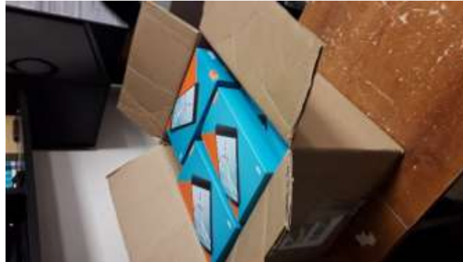
Ilustración 3. Tabletas adquiridas para la captura y transmisión inalámbrica de datos de órdenes de trabajo