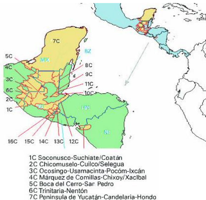
Figura 3. Los acuíferos transfronterizos entre México, Guatemala y Belice.

Aun cuando existen Comisiones Internacionales de Límites y Aguas en las tres naciones, no hay acuerdos, tratados o convenios relativos a los temas de aguas subterráneas transfronterizas.