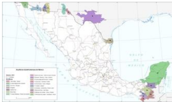
Figura 1. Localización de acuíferos transfronterizos (PHI-UNESCO-OEA-ISRAM Américas, 2008).

Por otro lado, Texas A&M ha realizado investigaciones para la delimitación de acuíferos transfronterizos compartidos entre México y