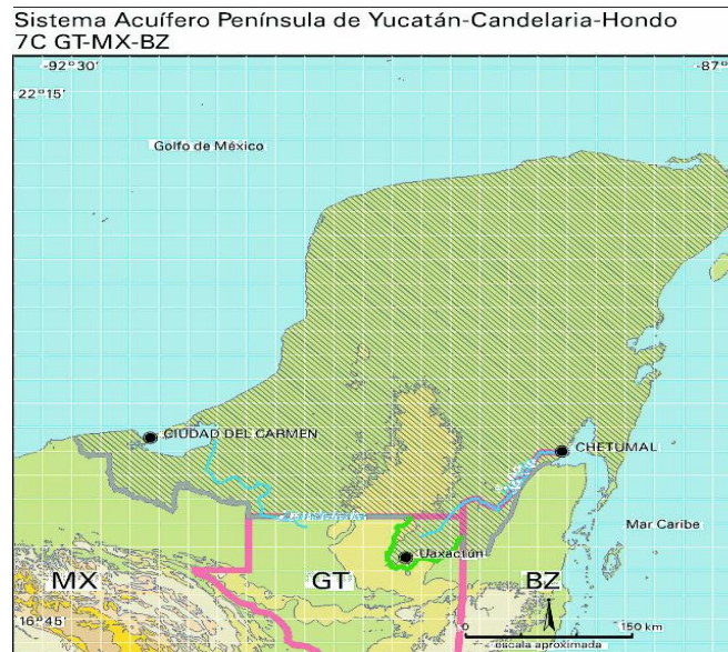
Figura 4. Acuífero transfronterizo, península de Yucatán, Candelaria Hondo, Belice, México y Guatemala.

Se asienta en una región de relieve plano con gran capacidad de infiltración, que conforma un acuífero cárstico de alta permeabilidad y altamente vulnerable a la contaminación antropogénica. Sin embargo, la abundante recarga y rápida circulación del agua propician la disolución y el transporte de los contaminantes, especialmente durante las lluvias torrenciales asociadas con los huracanes y las tormentas tropicales. Constituye la principal fuente de abastecimiento para la población rural. El conocimiento hidrogeológico es limitado debido al escaso desarrollo local en las porciones beliceña y guatemalteca (Figura 4).