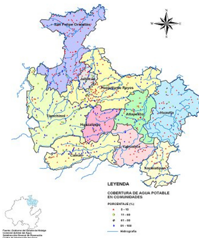
Figura 2. Acceso al servicio de agua entubada.

en las localidades, a la vez que con los desechos vertidos a los ríos por parte de la minera “Nonoalco”. En cuanto al problema con la insuficiente cantidad de agua se piensa que esto se debe a la intensa deforestación, así como al mal manejo de los sistemas de abasto y a la falta de una cultura del agua que dé importancia al ahorro del líquido. Finalmente, para la gente de Atlapexco, los problemas con la calidad del recurso se deben a las descargas de las aguas residuales que hacen los poblados ubicados a lo largo del río del mismo nombre; en relación con la escasez del vital líquido, se piensa que tiene que ver con la deforestación y los huracanes, pero también con el aumento de la superficie ganadera y con la extracción de grava y arena en las riberas de las corrientes de agua.